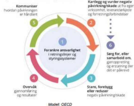
Figur 1 – Aktsomhetsvurderingens 8-trinn